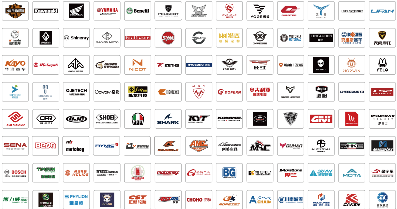
(上届部分参展品牌)